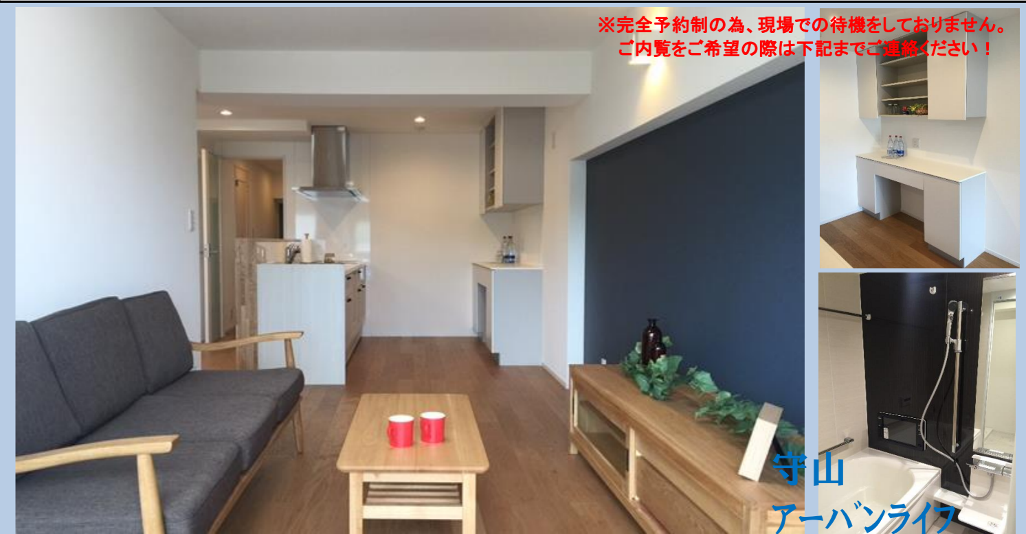
守山 アーバンライフ

※完全予約制の為、現場での待機をしております。 ご内覧をご希望の際は下記までご連絡ください!